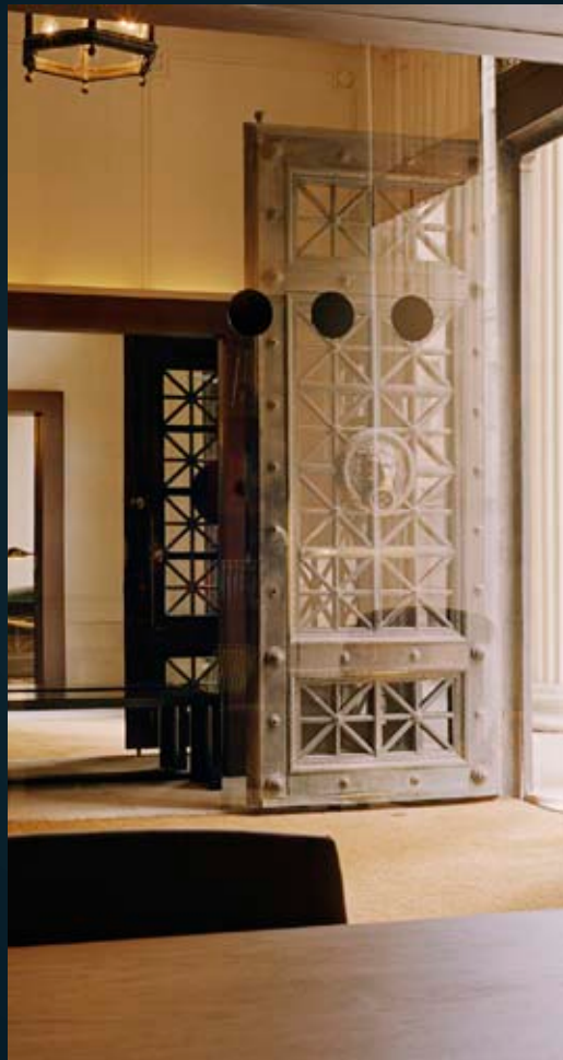
Entrada principal hotel. Hotel main entrance Entrée principale de l'hôtel