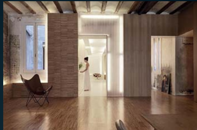
Restauración vivienda particular Private home restoration Restauration d'un logement privé