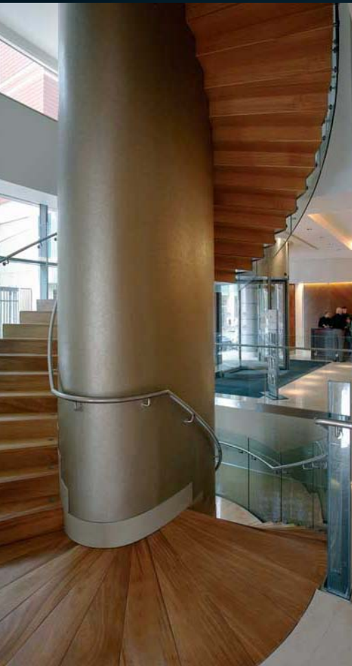
Escalera en madera maciza. Solid wood staircase Escalier en bois massif.