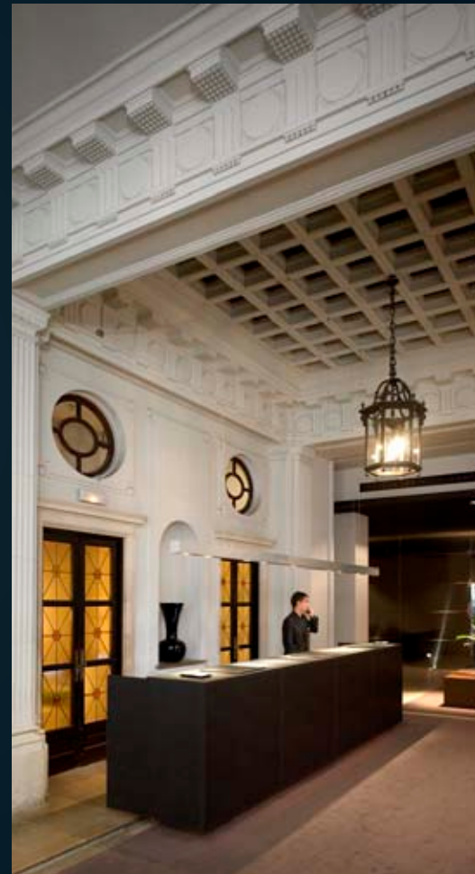
Recepción Reception Réception